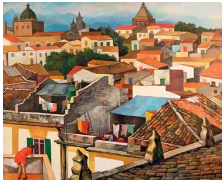
A sinistra: Renato Guttuso, Terra ai contadini , 1947 A destra: Renato Guttuso, Tetti di Palermo con Porta Nuova , 1985

il suo impegno politico sotto la bandiera del Partito Comunista, la cattedra di Sociologia dell'arte al Politecnico di Milano. Per lui l'arte deve essere socialmente responsabile, e nel momento della contestazione gli artisti non possono essere neutrali. Questo è anche il suo impegno nell'insegnamento, trasmettere la cultura come partecipazione diretta e consapevole al proprio tempo e alla propria società; ed è il motivo di alcune mostre, come Arte Contro. 1945-1970: dal realismo alla contestazione . Ma sono anche gli anni in cui il suo lavoro viene apprezzato in Italia e all'estero e gli vengono affidate le grandi mostre che animano la scena artistica italiana: Siqueiros a Firenze (1976), Orozco a Siena (1981), Marino Marini a Venezia (1983), Arturo Martini a Milano (1989), Henry Moore ancora a Milano (1989). Cura le grandi monografie dedicate a Picasso, Manzù, Guttuso.