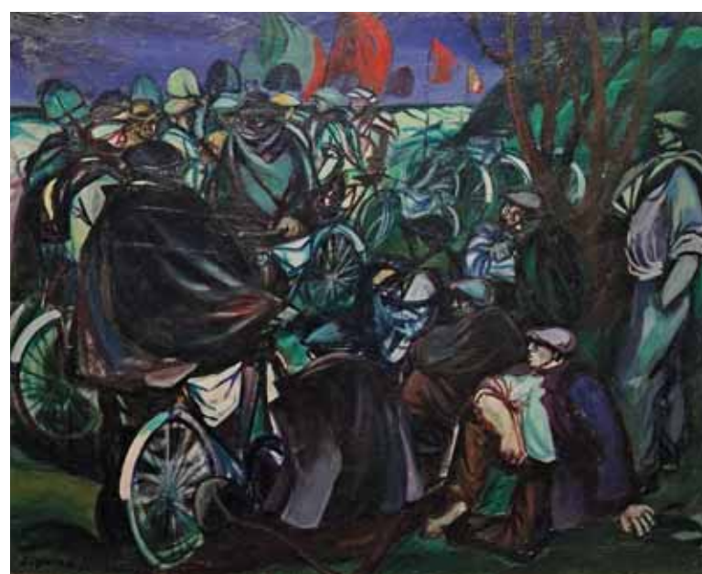
In basso: George Grosz, Burlak 42nd Street , 1932 A destra: Giuseppe Zigaina Assemblea di braccianti , 1951

anni concitati ma formativi, nei quali, partigiano egli stesso, conoscerà anche la prigione.